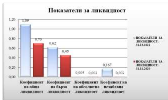
Таблица № 2