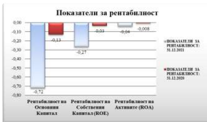
Таблица № 3